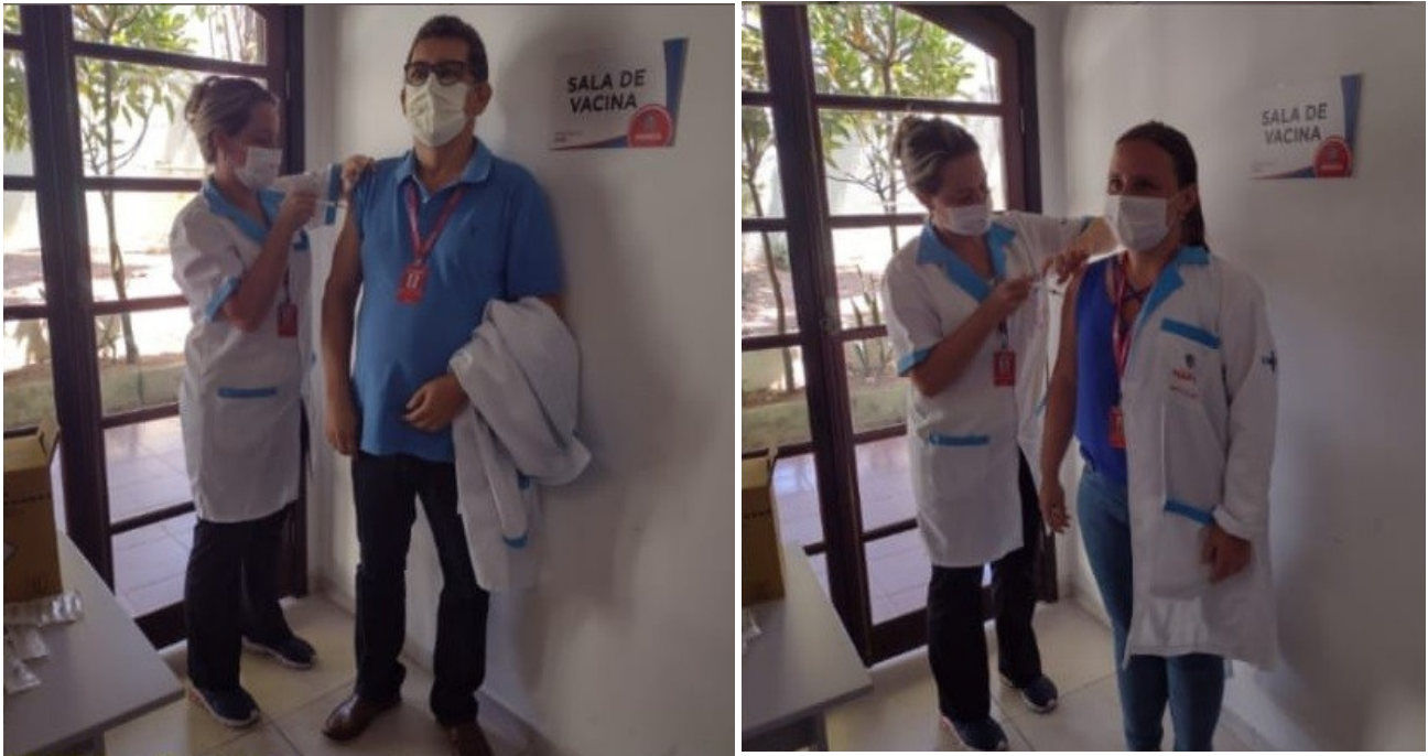
Fig. 3 e 4 – Profissionais da Equipe de vacinadores recebendo a vacina.

No momento, temos cerca de 15% profissionais vacinados, sendo eles: médicos, enfermeiros, técnicos de enfermagem e dentistas, pois estes compõem a equipe de vacinadores da RUE e posteriormente de todo o município de Maricá.