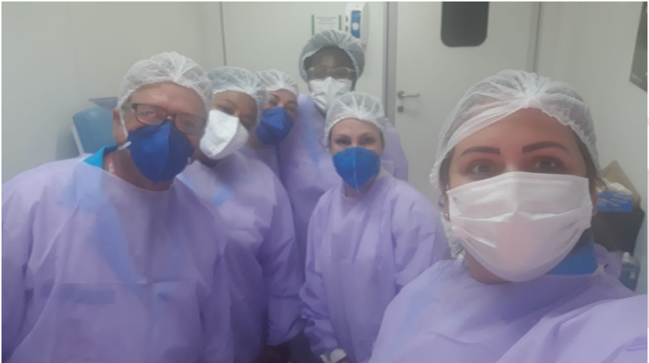
Fig.2 – Equipe de vacinadores da Atenção Primária a Saúde paramentada para vacinação na UPA.